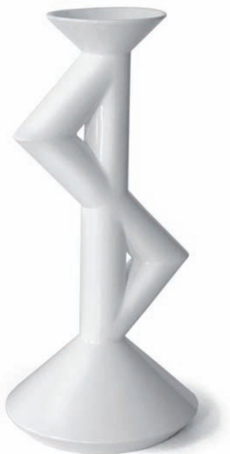
Double ZAG émaillé en blanc h. 34 cm

Nous sommes heureux de poursuivre avec vous cette aventure qui a contribué déjà grandement au développement de notre atelier et nous vous remercions chaleureusement journalistes, décorateurs, acheteurs et fans d'avoir révélé et accompagné cette collection !