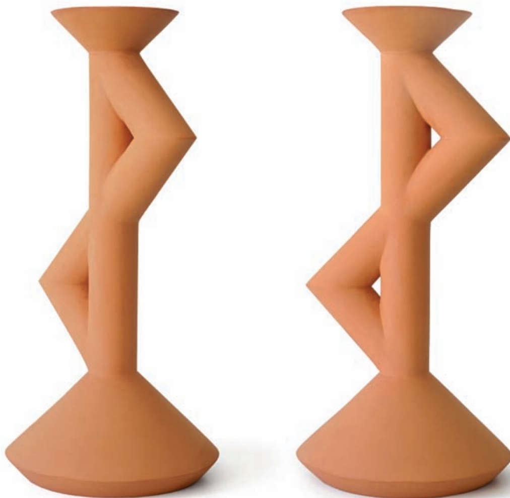
Double ZAG terracotta h. 34 cm